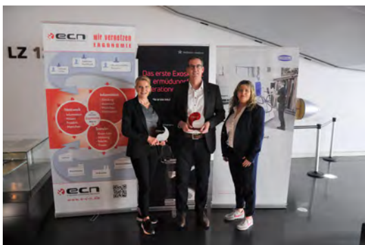
Träger der Ergonomiepreise 2023: Hellstern medical GmbH (links und rechts) und J. Schmalz GmbH (Mitte)

Der ECN e.V. möchte den Austausch von Ergonomie-Know-how unter seinen Mitgliedern fördern, steht aber auch Nichtmitgliedern mit Rat und Tat zur Seite.