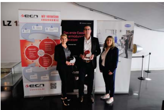
Träger der Ergonomiepreise 2023: Hellstern medical GmbH (links und rechts) und J. Schmalz GmbH (Mitte)

Fester Bestandteil der Tage der Ergonomie ist die Verleihung der ECN-Ergonomie-Preise in den Kategorien „Handgeführte Produkte“ und „Innovative Ergonomie“. Die Verleihung der Ergonomie-Preise findet als Teil der festlichen Abendveranstaltung der Tage der Ergonomie im Schloss Montfort in Langenargen am Bodensee statt.